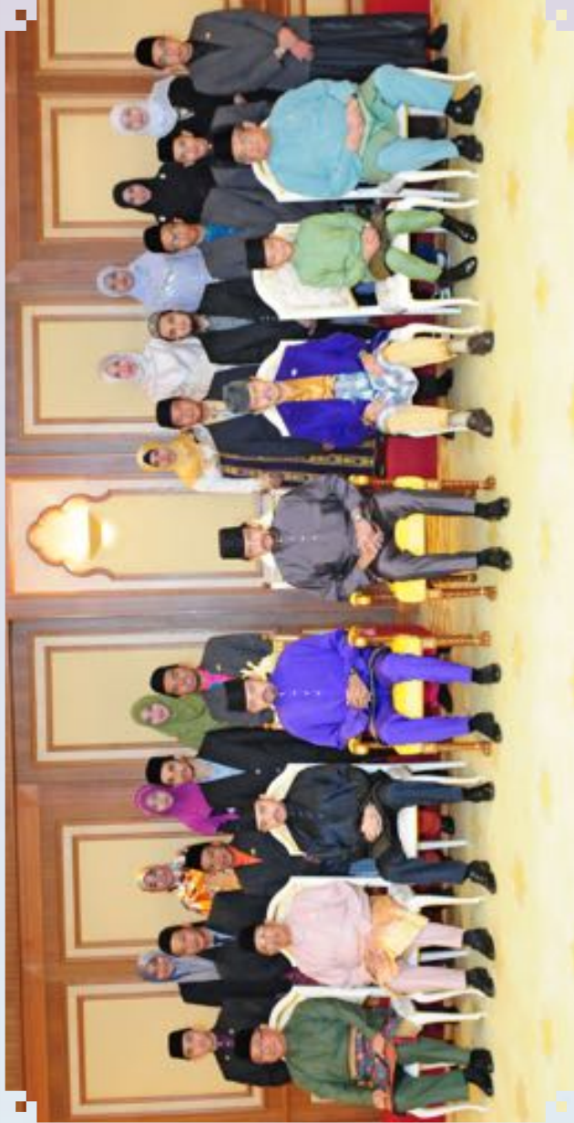
KEBawah DULI YANG MAHA MULIA PADUKA SERI BAGINDA SULTAN DAN YANG DI-PERTUAN NEGARA BRUNEI DARUSSALAM DAN KERABAT DIRAJA BERSAMA PESERTA-PESERTA MUSABAQAH TILAWATIL QUR'AN BELIA ASIA TENGGARA KE-7 1436/2015 HIS MAJESTY SULTAN AND YANG DI-PERTUAN OF BRUNEI DARUSSALAM

IN A GROUP PHOTO WITH THE PARTICIPANTS OF THE 7TH SOUTHEAST ASIAN YOUTH AL-QURAN READING COMPETITION 1436/2015