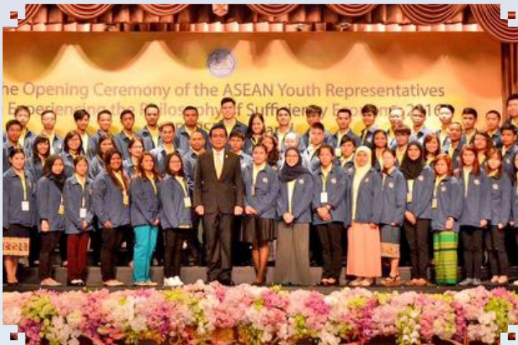
Wakil-Wakil Belia ASEAN dalam Seminar Ekonomi The ASEAN Youth Representatives in Experiencing the Philosophy of Sufficiency of Economy 4 - 10 October 2016, Thailand