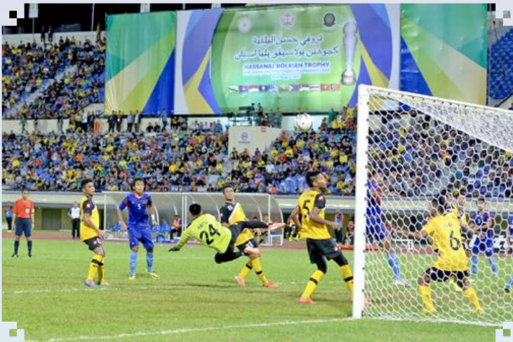
Trofi Hassanal Bolkiah bagi Kejohanan Bola Sepak Belia ASEAN Hassanal Bolkiah Trophy for ASEAN Youth Football Championship