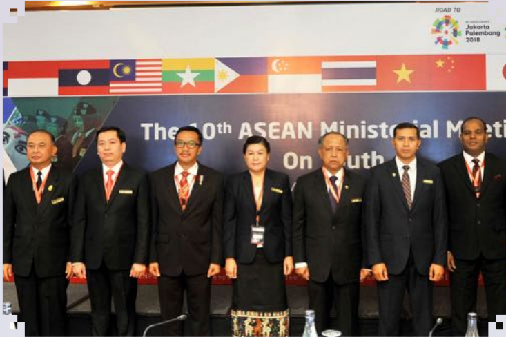
Mesyuarat Menteri-Menteri Belia ASEAN ASEAN Ministerial Meeting on Youth 2017, Jakarta, Indonesia