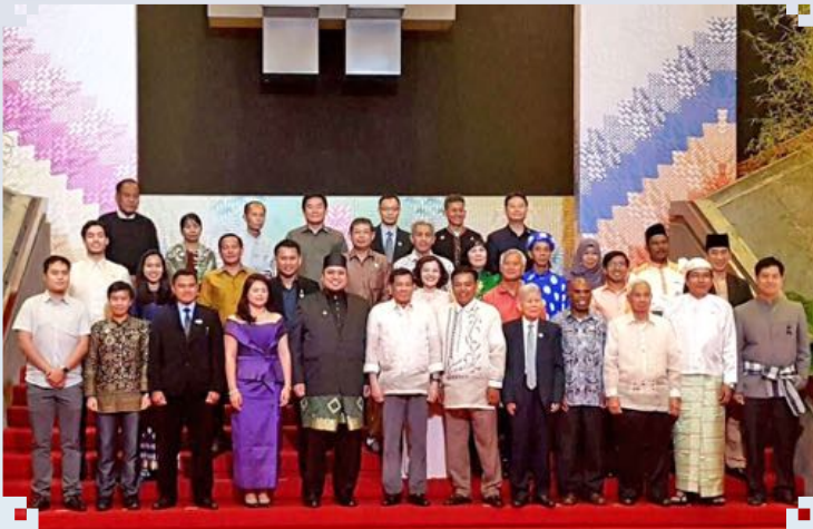
Anugerah Usahawan Belia ASEAN ASEAN Youth Social Entrepreneurship Award 7 - 8 August 2017, The Philippines