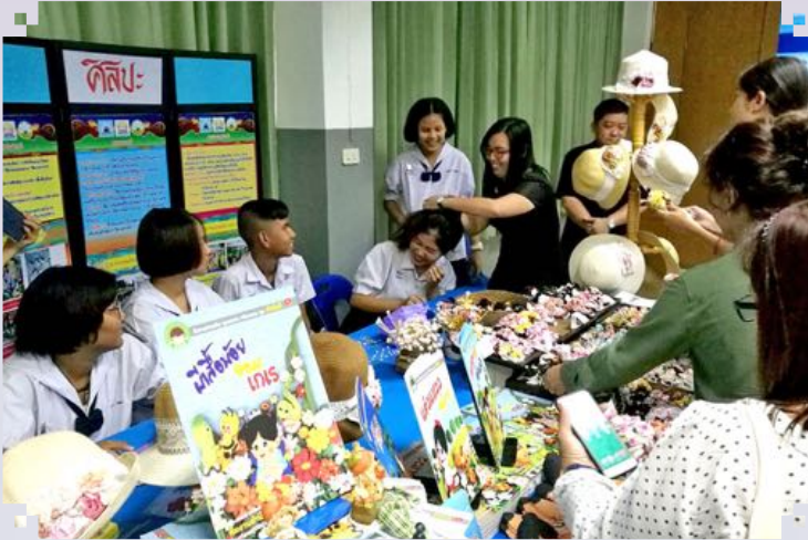
Program Pertukaran Sukarelawan Belia Youth Volunteers Exchange Programme 2017, Bangkok, Thailand