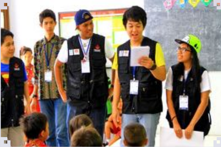
Program Sukarelawan Belia Profesional ASEAN ASEAN Young Professionals Volunteer Corps Programme 24 August to 8 September 2013, Palembang, Indonesia