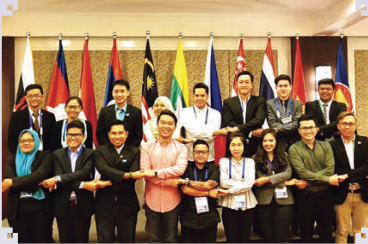
Pertemuan Ketua-Ketua Belia ASEAN dengan Ketua Negara / Kerajaan ASEAN ASEAN Youth Leaders Interface with ASEAN Leaders 2017, The Philippines