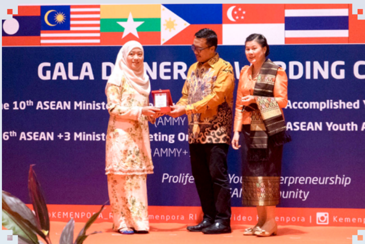
Majlis Anugerah Organisasi Belia Berjaya ASEAN ASEAN Accomplished Youth Organisations Award 19 and 20 July 2017, Jakarta, Indonesia